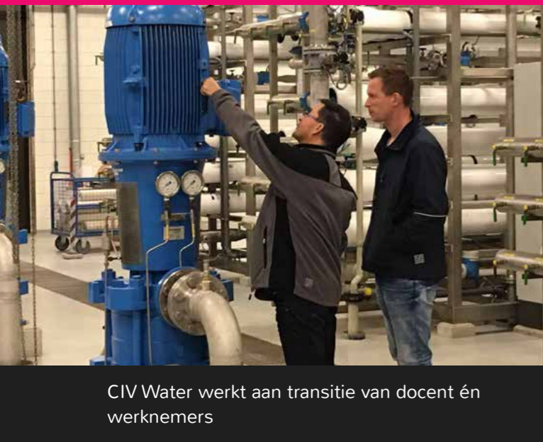
CIV Water werkt aan transitie van docent én werknemers

Leren eindigt al lang niet meer bij een diploma mbo, hbo of wo. Om de banen van de toekomst te kunnen vervullen, is het nodig dat mensen zich continu blijven ontwikkelen. Hierbij vinden onderwijsinstellingen en bedrijven elkaar in innovatieve opleidingstrajecten.