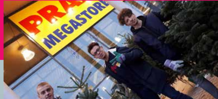
Drie deelnemers aan de PPS Talent in bedrijf voor de ingang van hun werk-leerbedrijf.

Opleiden in de praktijk kan ook een uitkomst zijn voor jongeren die niet gedijen in een schoolse setting. Begeleiders en praktijkopleiders helpen hen in slimme samenwerkingsverbanden op weg naar een vervolgopleiding of een baan.