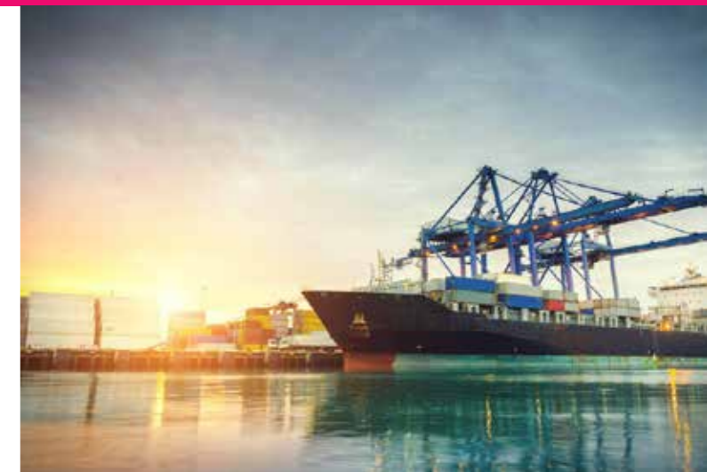
KennisDC Logistiek zorgt voor efficiency door innovatief te denken.

In bestaande projecten worden deze taken uitgevoerd door mensen met de volgende rollen: lector, practor, docent-onderzoeker, studentbegeleider, coach, initiator van projecten, tussenpersoon bedrijven-onderwijs, opdrachtgever.