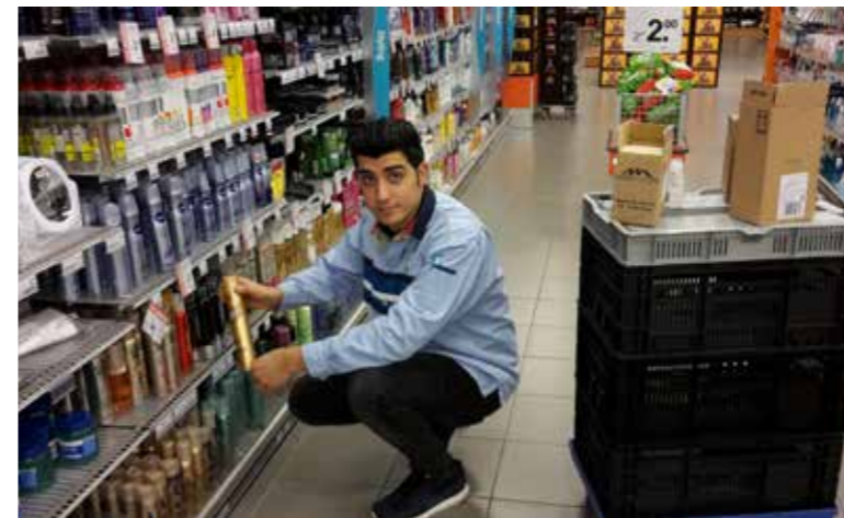
Deelnemer aan de PPS Talent in bedrijf bij AH XL in Venlo.

"Gewoon proberen en héél véél geduld hebben! Ik begin bij A en als we bij C zijn en de leerling begrijpt het nog niet, dan beginnen we gewoon weer van voren af aan. Ik heb vorig jaar veel steun gehad aan de mensen van Gilde Opleidingen. We konden bij elkaar aankloppen. We hebben het eigenlijk samen gedaan."