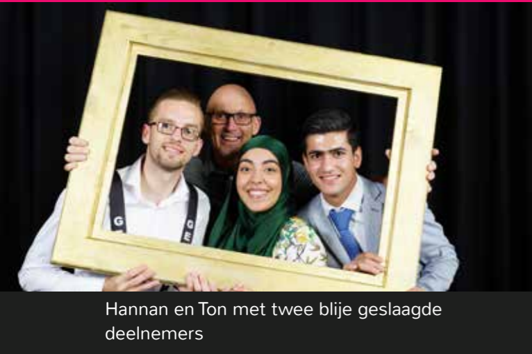
Hannan en Ton met twee blije geslaagde deelnemers